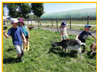
MINI CAMP 5 - 7 ans FERME DE KEMO 17 enfants