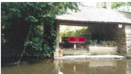
Les lavoirs du Trieux