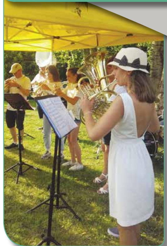
Fête de la Musique et des Arts 2019