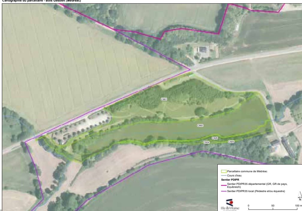
Cartographie du parcellaire - Bois Gesbert (Médréac)

Ce projet ambitieux a pour objectif avoué de renforcer l'attrait touristique de notre cité, mais aussi d'ancrer au sein de ces lieux des approches et pratiques ludiques, sportives, culturelles et pédagogiques.