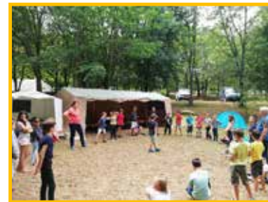
MINI CAMP 6 - 10 ans NATURE 30 enfants

en partenariat avec les accueils de loisirs de