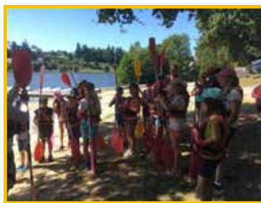
MINI CAMP 9 - 12 ans SPORTIF 19 enfants