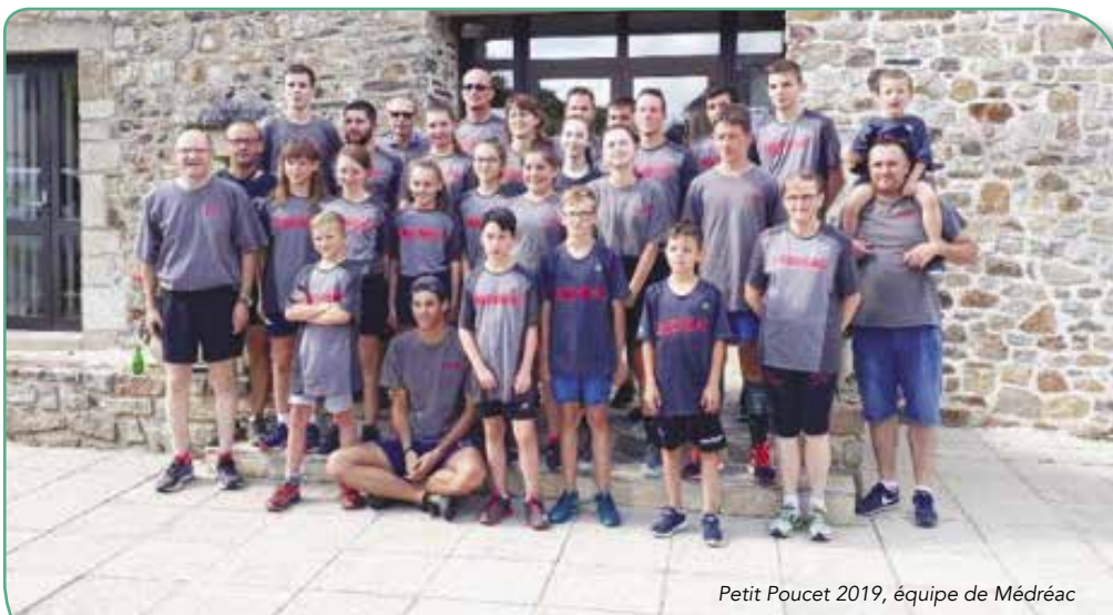
Petit Poucet 2019, équipe de Médréac

Pour participer aux Vendredi du Rail, à la fête de la Musique et des Arts et au Relais du Petit Poucet, contactez-nous par notre page Facebook « Comité des Fêtes de Médréac » ou par mail : mailchimene@gmail.com