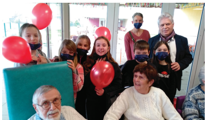
GALETTE DES ROIS MAISON DE RETRAITE